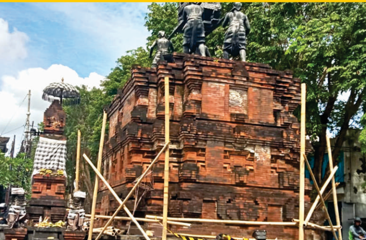
Sebelum pengecatan, dinding bata ekspos berlumut