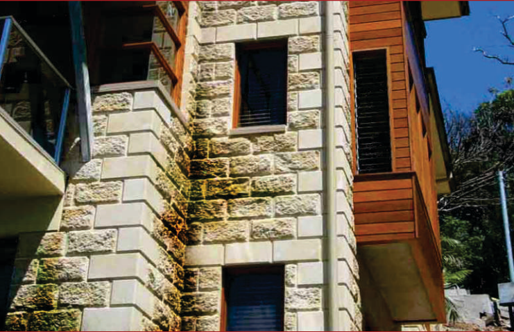
Sebelum pengecatan, dinding batu alam berlumut