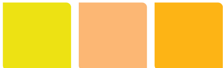
938 Jasmine 951 Spring Yellow 906 Golden Yellow