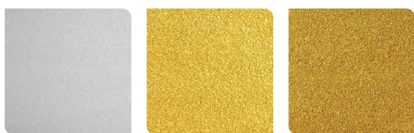
NEW PM001 Silver NEW PM201 Light Gold NEW PM202 Gold