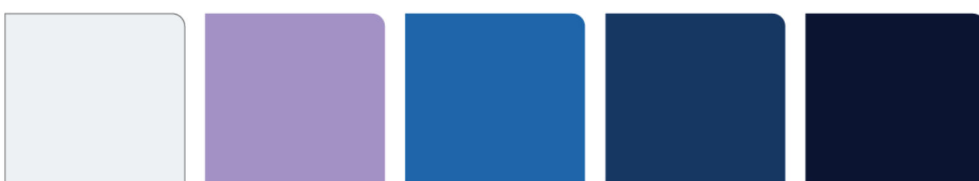
1149 Putih 960 Lilac Violet 942M Bright Blue 942 River Blue 902 Azure Blue