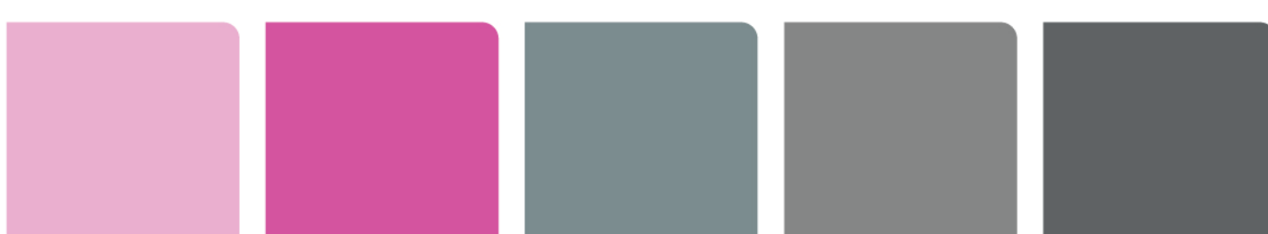
948MC Light Pink 975 Pink Tulip 921 Light Grey 973 Iron Grey 920 Medium Grey