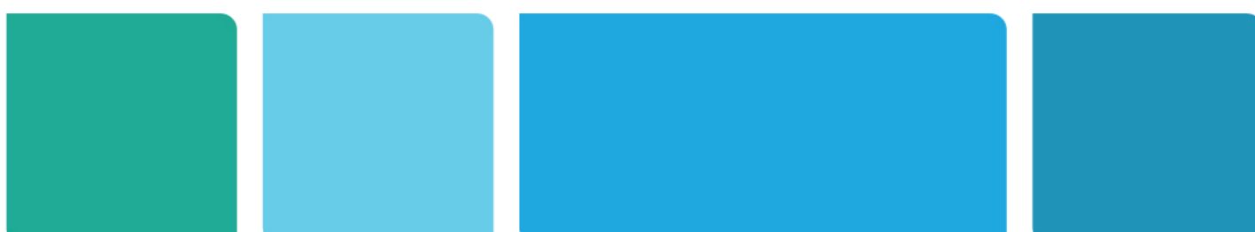
916 Medium Turquoise 904 Princess Blue 968 Mc Blue 903 Neptune