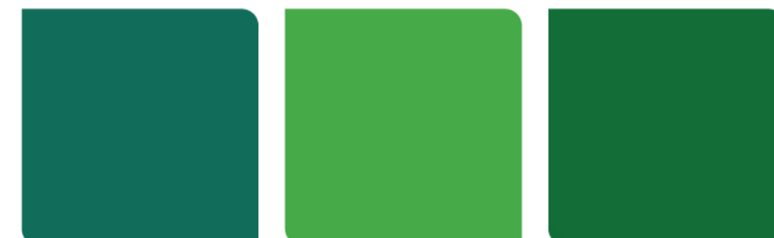
910 Turquoise 963 Laurel Green 925 Emerald Green